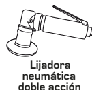
Lijadora neumática doble acción